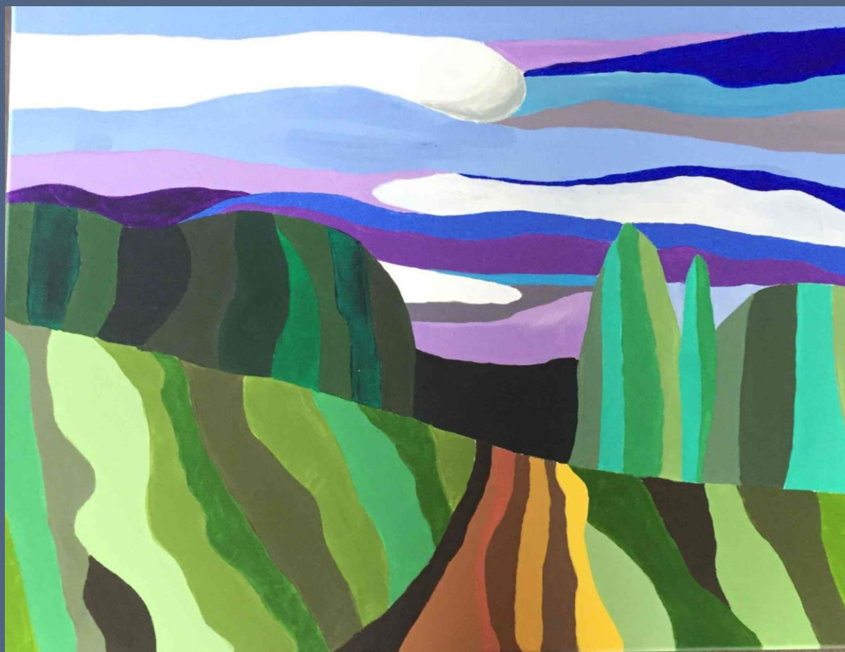
Gatavais darbs uz audekla.