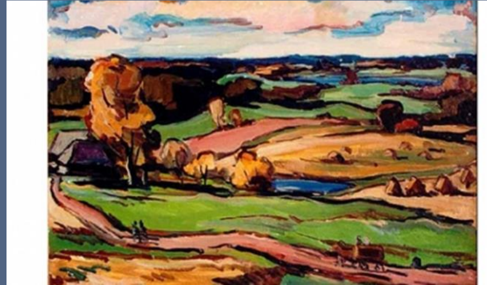
Viens no mākslas darbiem no kuriem es iedvesmojos. Mākslinieks Ādolfs Melnārs.