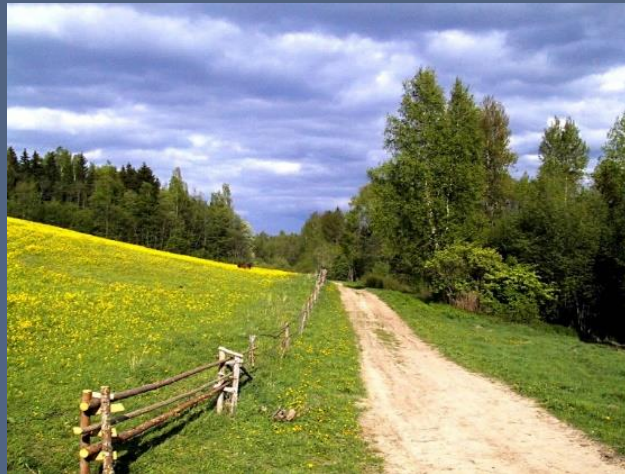
Latvijas ainava no kuras es iedvesmojos.